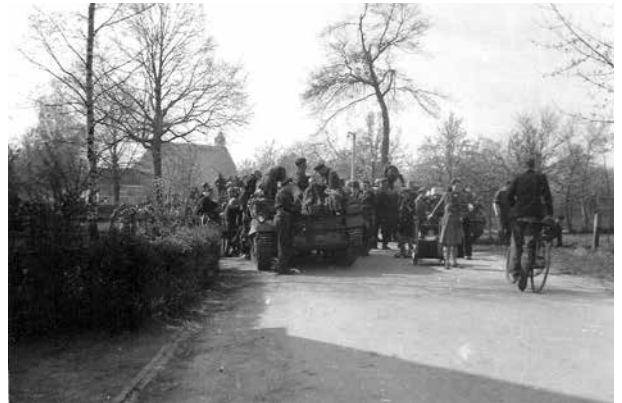
5 Mei 1945: Zaterdagmorgen om 8 uur was heel Nederland vrij. Ook in Diepenveen was er feest. Optocht, muziek, dansen. Een voetbalmatch tussen D.S.C. en een Engels elftal. Na vijf jaar onder de moffen te zijn geweest, eindelijk weer vrij. Lang leve ons vrije Nederland. Lang leve ons geliefd Oranjehuis."

mocht mee in een tank. Hij kreeg direct een revolver. Dat was een enig gezicht. Een half uurtje later kwamen ze terug. Toen moest ik de accordeon halen en mijnheer speelde het Wilhelmus en het God save the King. Daarna moest ik met twee Canadezen naar Sandhof om ze "a nice bath" te geven. Sandhof was no 1 met de vlag. Iedereen tooide zich zo gauw mogelijk met Oranje en was dadelijk op z'n Paasbest gekleed om toch maar niets mis te laten gaan. 's Middags hebben we met de Canadezen gepraat en twee kwamen 's avonds naar Sandhof. Mijnheer en mevrouw waren er ook bij. We hebben met hen door de kamers gehost en door de tuin. Om elf uur gingen we nog met een heel stel door het dorp vaderlandse liederen zingen. Het was een dag om nooit te vergeten.