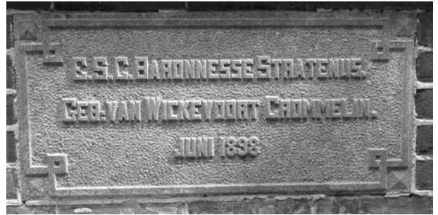
Gevelsteen in het huis Schapenzandweg 7. De initialen kloppen niet en hadden 'E.C.S.' moeten zijn.