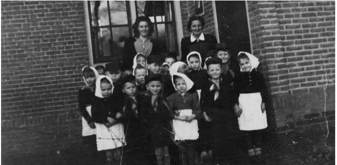
Schoolklas Slingerbos 1945

Op 15 mei 1946 konden de kleuters uit Diepenveen voor het eerst in hun eigen dorp naar school, op dezelfde tijden als de lagere school; 's ochtends van 9-12 uur en 's middags van 2-4 uur. Op zaterdagmiddag 18 mei, 's middags om 16.00 uur vindt de officiële opening plaats van de bijzondere kleuterschool Diepenveen, waarvoor ook de Gemeenteraad van Diepenveen wordt uitgenodigd.